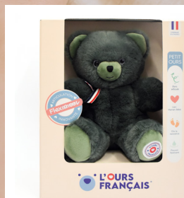
Présenté dans une boîte cadeau pour les plus petits ours.

A la maternité, Maman le transmettra à bébé pour l'accompagner dans ses premiers pas et ses premiers émois !